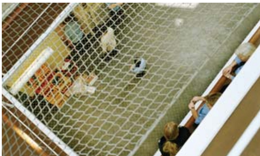
Der er net mellem hver etage så de indsatte ikke kommer til skade hvis de hopper eller falder ud over gelænderet