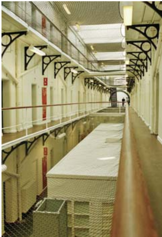
2. etage på Blegdamsvejens Fængsel

Alle tre måltider bliver spist i cellerne. I løbet af dagen er der mulighed for at besøge et lille fængselsbibliotek, være i et kondirum, modtage besøg af to andre fanger i sin celle i et såkaldt fællesskab eller modtage undervisning, primært på folkeskoleniveau. Man kan også arbejde i fængslet enten med vedligeholdelse eller med akkordarbejde i cellerne, der eksempelvis består af at samle ledningsholdere til 14 kr. for 1000 stk.