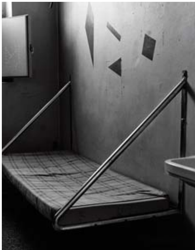
Typisk seng i en celle, th. en udluftningskanal med et lille vindue ovenover

På første etage sidder de indsatte, man betragter som rolige, og de har deres dør åben en del af dagen. Bortset fra det er de indsatte låst inde næsten hele tiden; i deres celler, når de er i bad, i kondirummet, på biblioteket, når de har besøg osv.